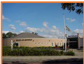
Zwembad Maesemunde Koningin Julianaweg 158 2691 GH 's-Gravenzande