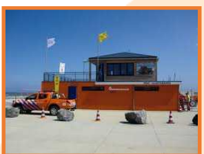
Strandpost Vlughtenburg Nieuwlandsedijk 22 2691 KW 's-Gravenzande Telefoonnummer 0174 44 06 44 (Strandpost beperkt bereikbaar voor voertuigen)