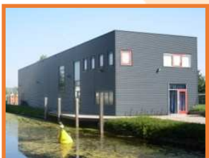
Training- en onderhoudscentrum "Zuid-West 9" Koningin Julianaweg 154 2691 GH 's-Gravenzande (Bereikbaar via parkeerplaats van Juliana Sportpark)